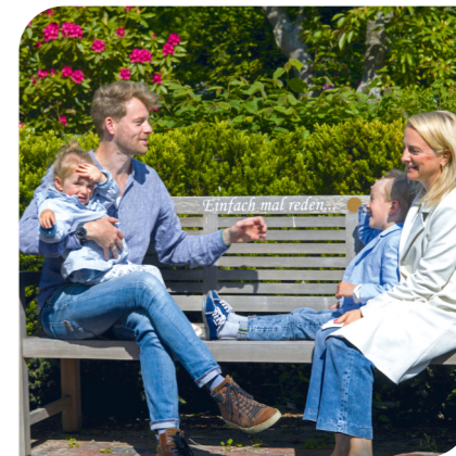
Familiensache: Schnack auf der Bank am Urnengemeinschaftsfeld