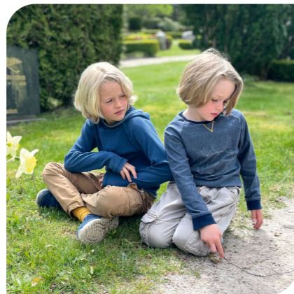
Tag des Friedhofs: Hej, was krabbelt dort, was summt denn hier?