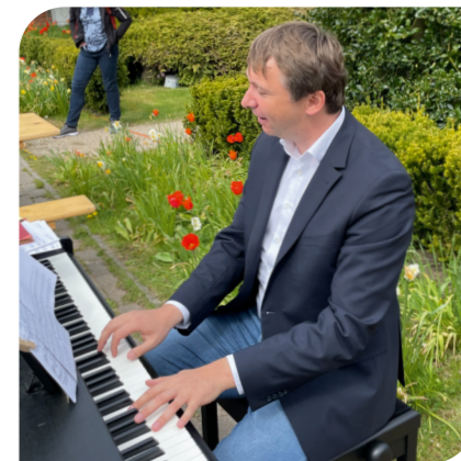
Organist open air: Friedhofsfest musikalisch begleitet