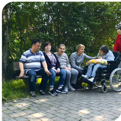
Barrierefreie Wege: regelmäßig gut besuchte Bänke