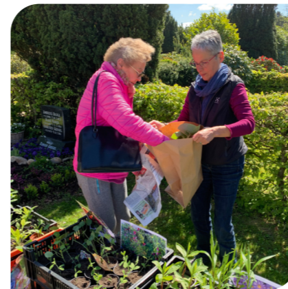
Hier zu haben: Pflanzenhandel mit Wortwechsel