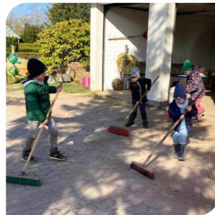
Nachwuchs bringt sich in Stellung: „Wurzelkinder“ in Aktion