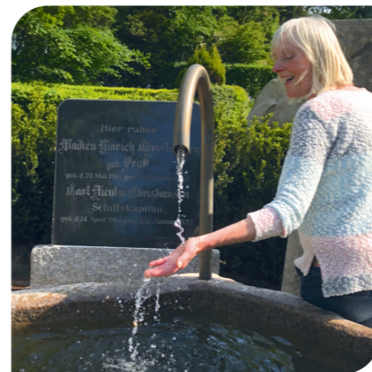
Herzerfrischend: Wasserspiele an unserem Brunnenplatz