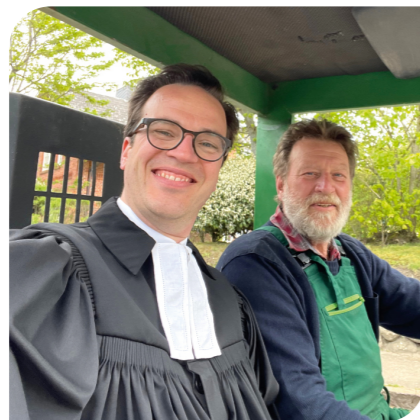
Stets bereit: spontane Dienstfahrt durch die grünen Oasen