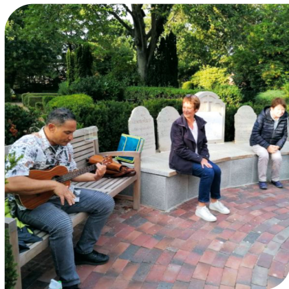
Treffpunkt Brunnenplatz: Biblisches erzählt, musikalisch untermalt