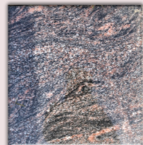
Grabplatte (30 x 30 cm)

Am Findling können Sie Gestecke und Blumen ablegen. Die Pflege übernimmt unser Friedhofsgärtner.